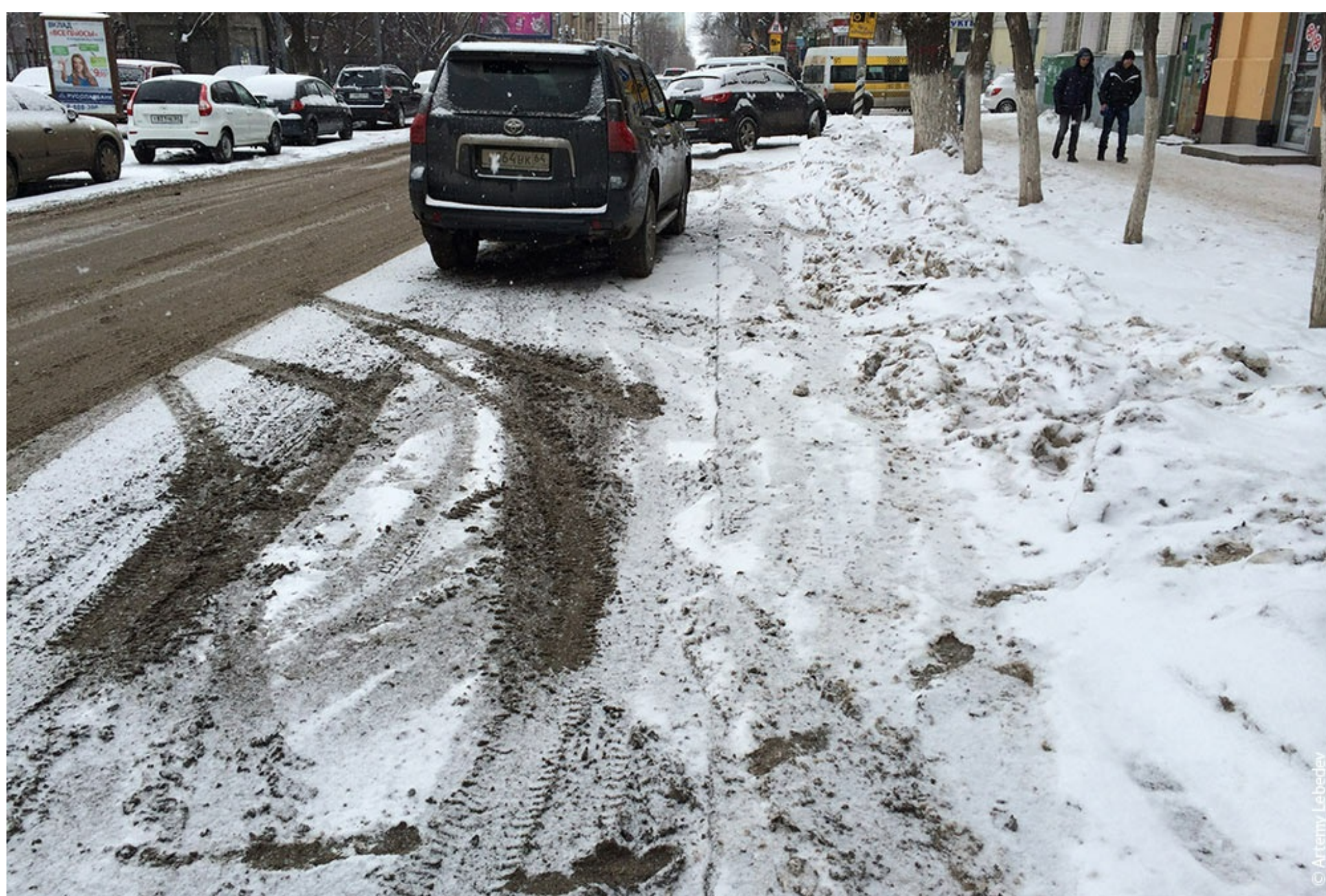
Дрифт превращается в суспензию, которая висит в воздухе на высоте до пяти метров, что подтвердит любой водитель, у которого при температуре около нуля расходуется пятилитровая баклажка стеклоочистителя за полчаса.