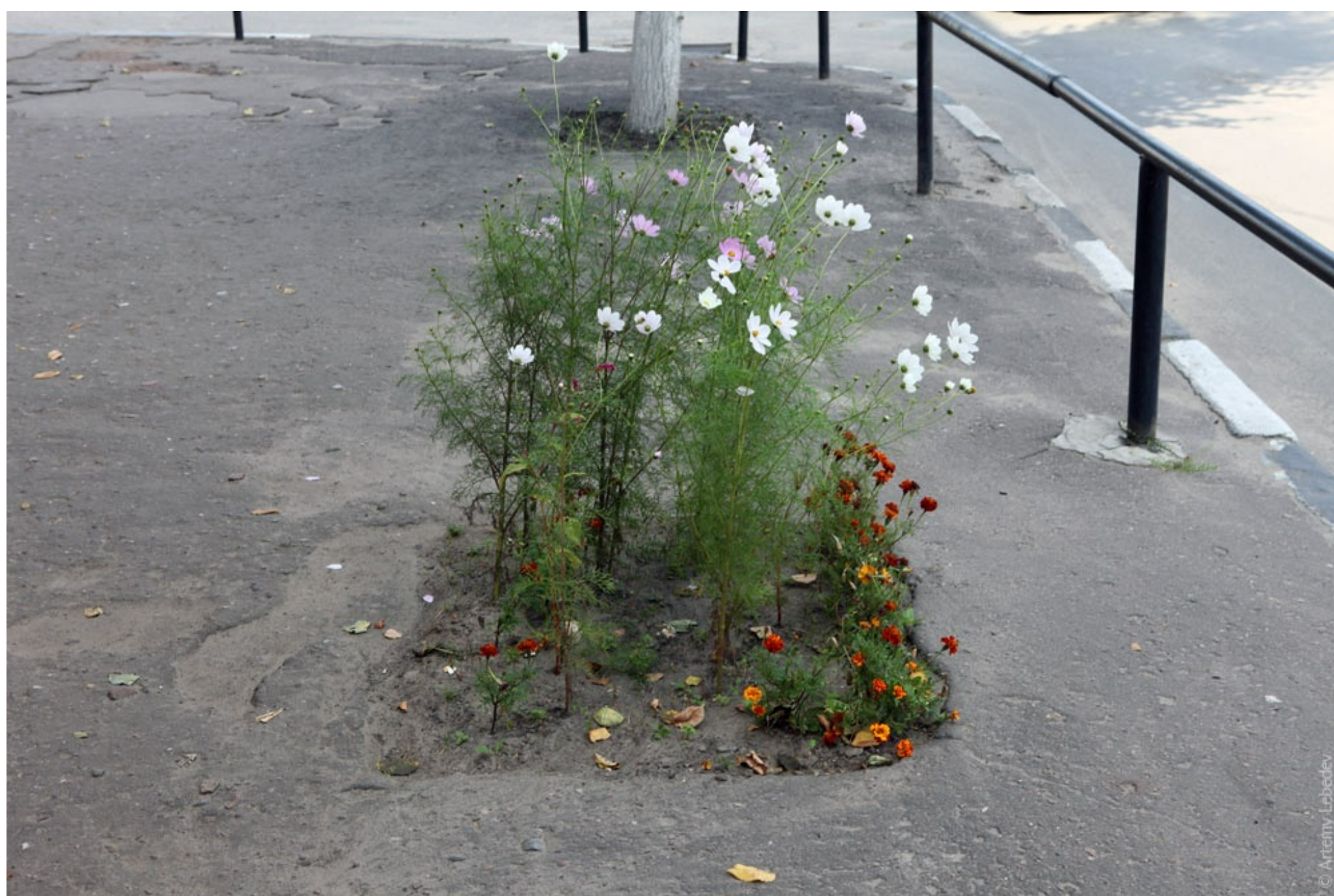
Трасса Ярославль - Москва.