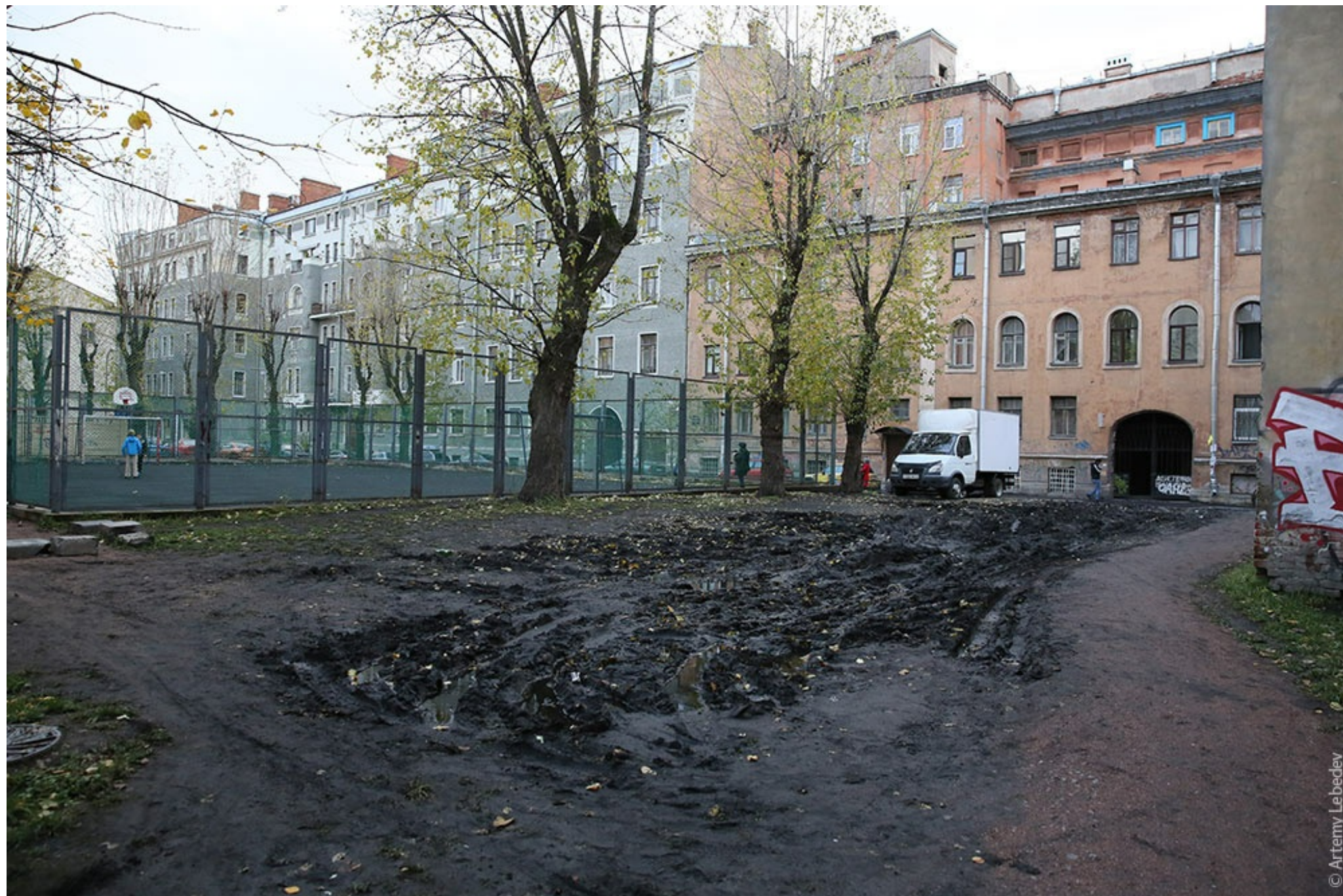
Основа русской духовности. Сергиев Посад.