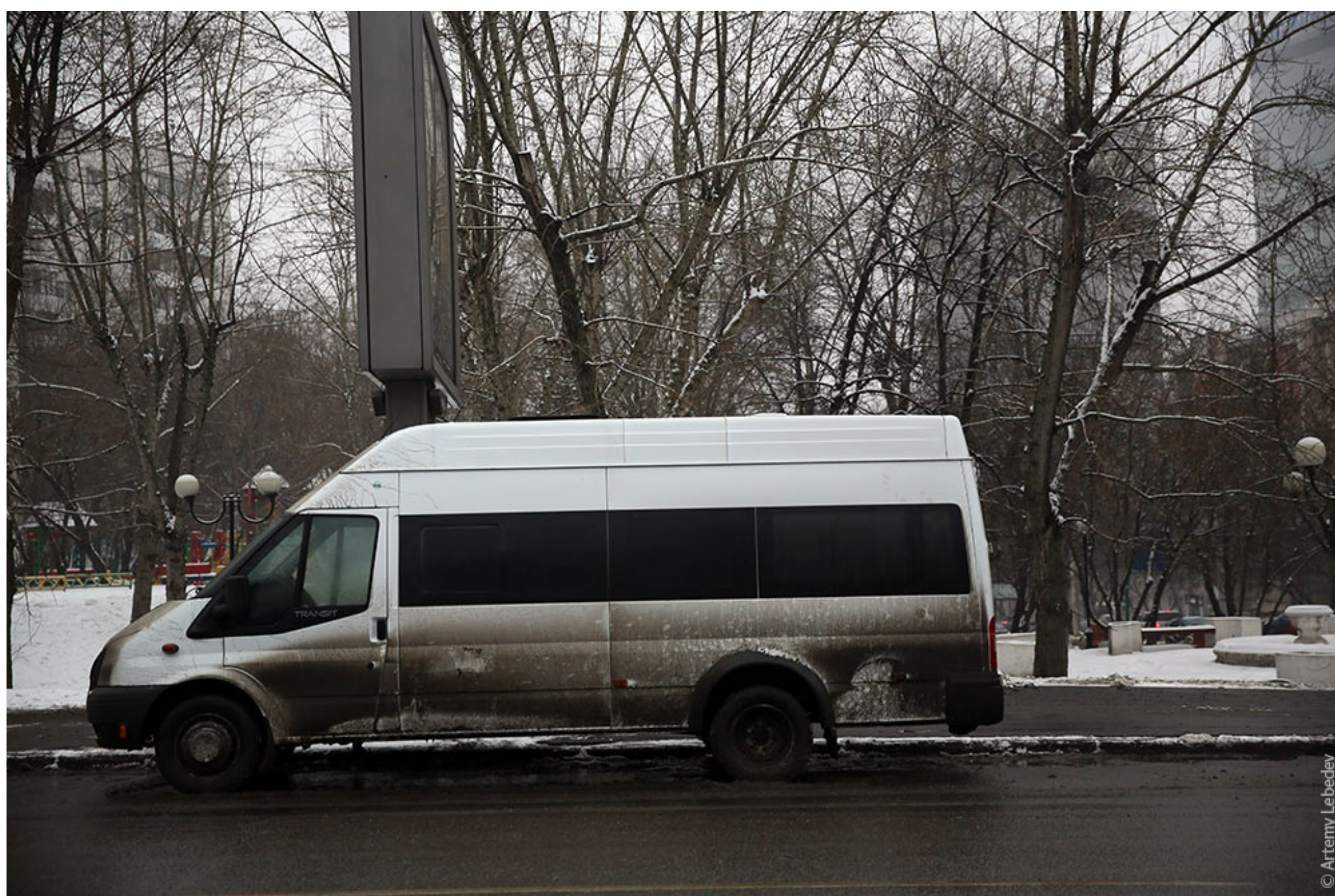
Кто в Москве не бывал, красоты не видал.