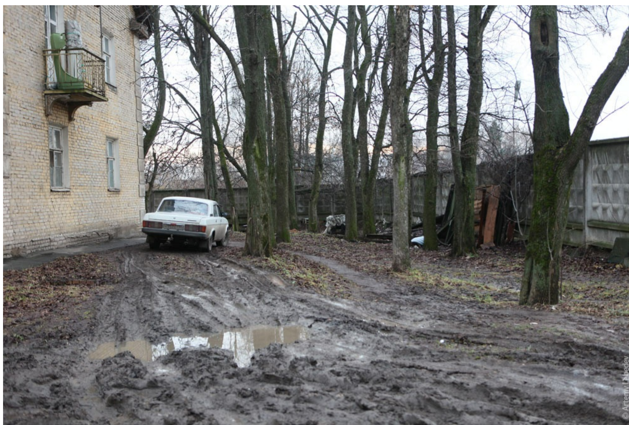
Выпавший снежок ненадолго прикрывает слой дорожного говна, но быстро тает. Саратов.