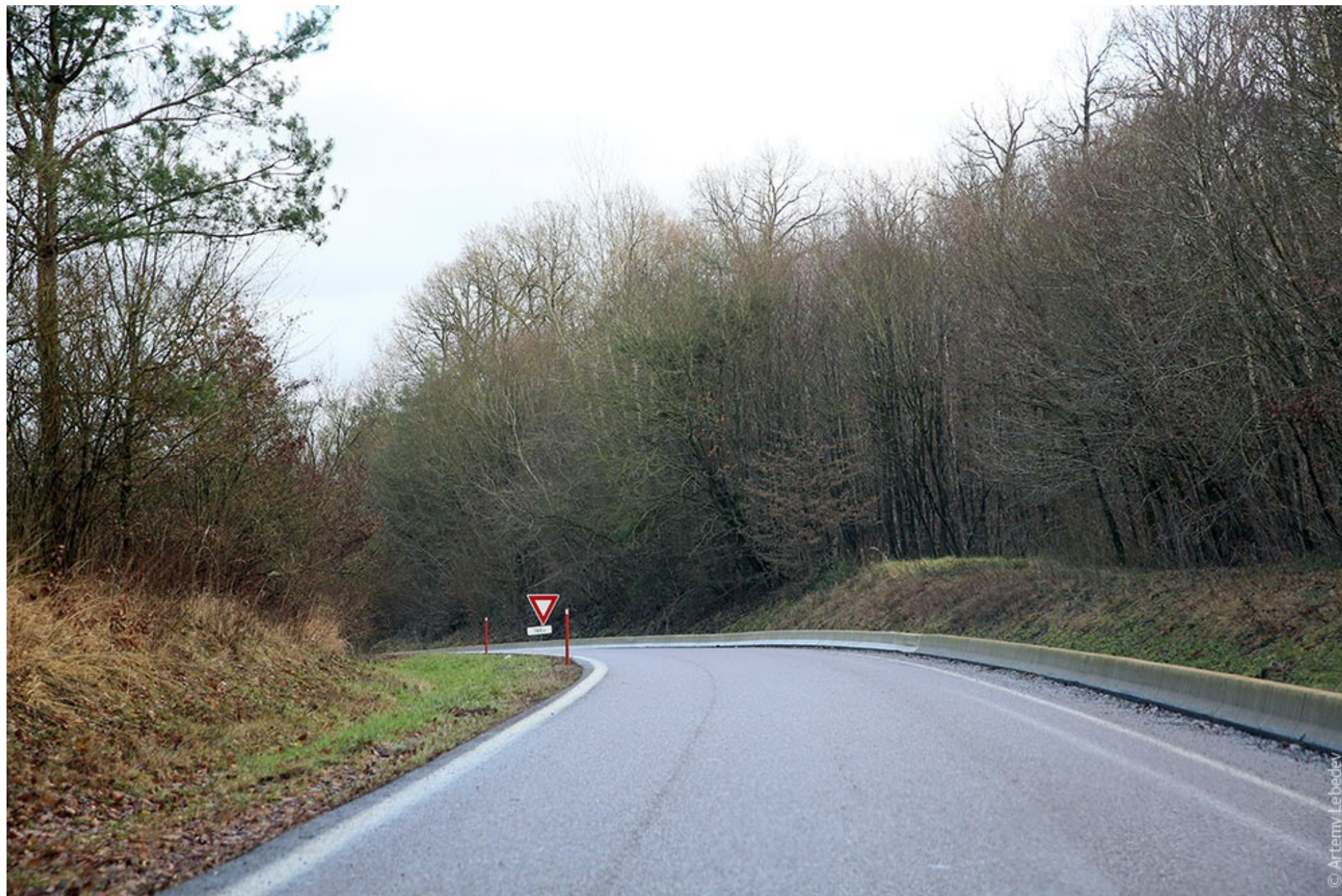
Швейцария. Большой объем наклонного говна. Что делают умные люди? Отсыпают края щебнем.